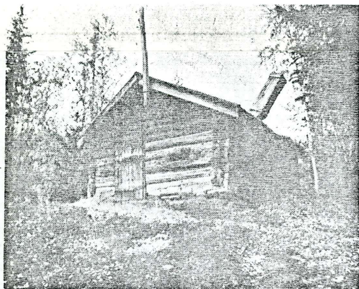
Første bygg på Undals Verk. Gammelsmia fra 1860.

Norges Geologiske Institutt Bergarkiv Rapport nr. 6620